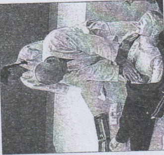
Formation des aikidokas au massage cardiaque.

ge efficace et une défibrillation précoce permettaient de récupérer jusqu'à 70 % des arrêts cardiaques. Chaque minute compte et toutes les minutes passées sans massage efficace nous perdons 10 % de nos neurones. " A la fin de la formation chacun a reçu un petit document synthétique de la fédération française de cardiologie sur les conduites à tenir face à un arrêt cardiaque.