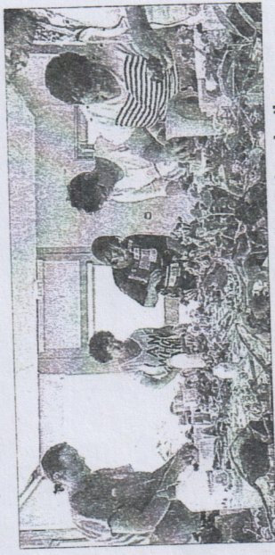
Chaque participante a laissé libre cours à son imagination.

Chaque participante s'est appliquée à réaliser une composition à partir de livres et a laissé libre cours à son imagination pour ramener à la maison une œuvre aux couleurs de l'automne. Emmanuelle propose de réaliser une mosaïque florale lundi 7 novembre.